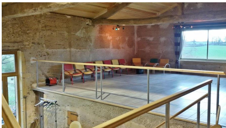
La vaste salle très lumineuse, réservée aux activités.