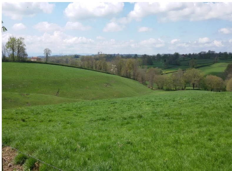
La nature environnante calme et apaisante