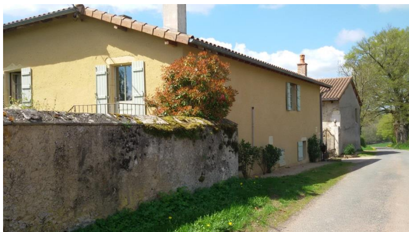
La Goutte Berthaud