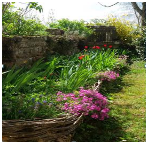
Un joli massif pour pratiquer les activités Bates