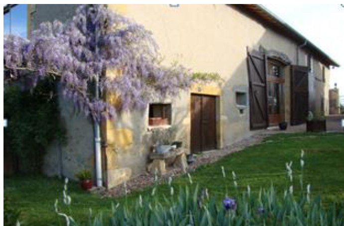
La Maison du Temps pour Soi