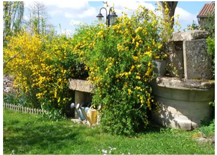
Un jardin luxuriant