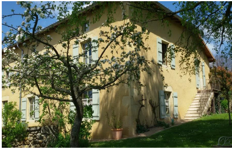
Une maison d'hôtes pleine de charme